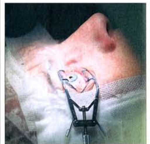
Ziel: das Auge während der Behandlung.