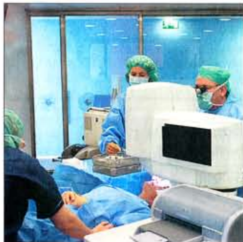
Team: der Blick in den Operationssaal.