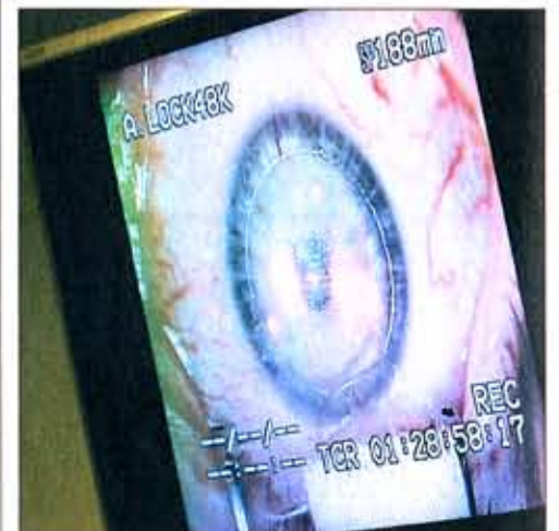
Grossaufnahme: das Geschehen am Bildschirm.